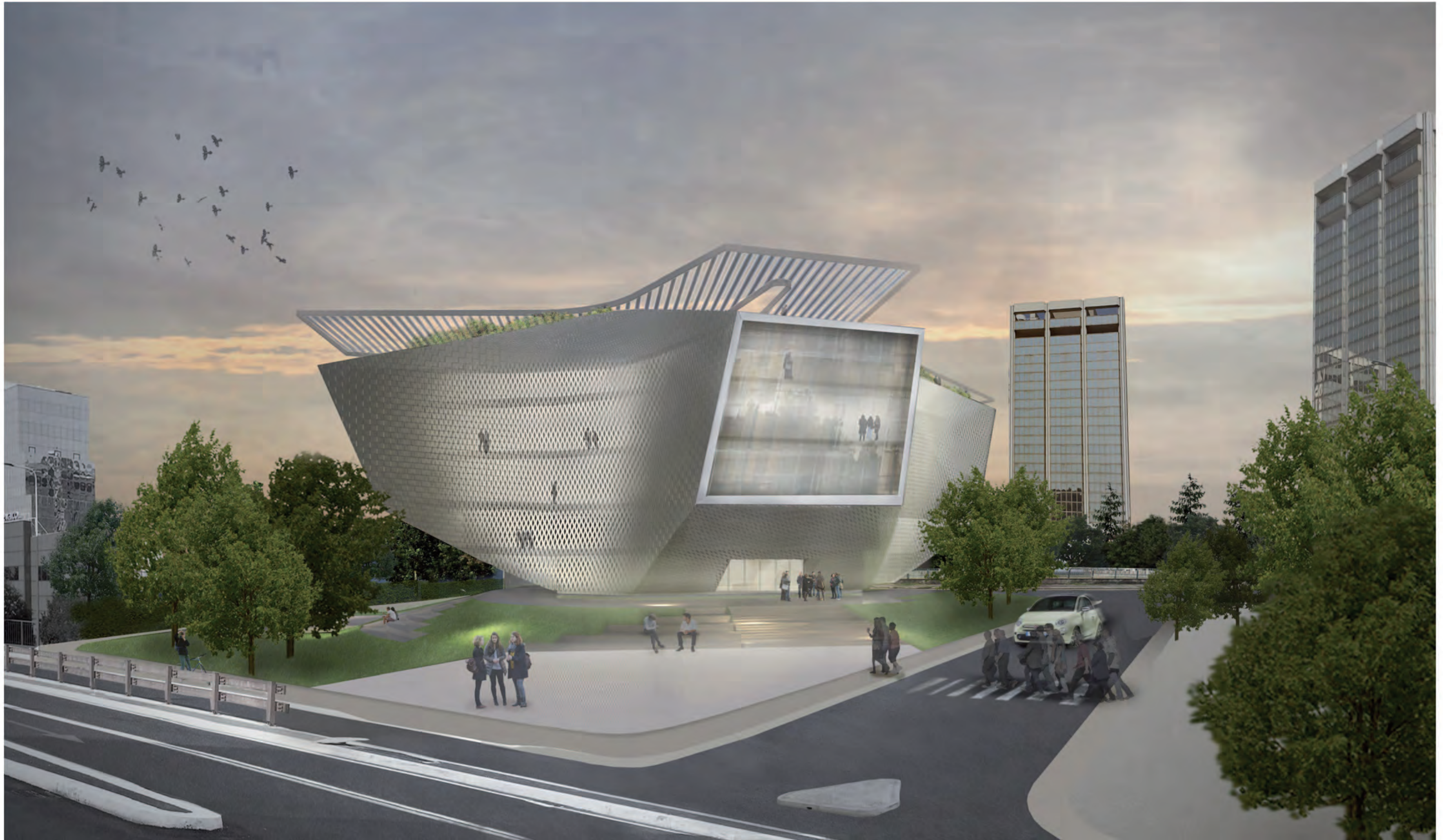
VISTA DA VIA STEPHENSON (FRONTE HOTEL BARCELO')