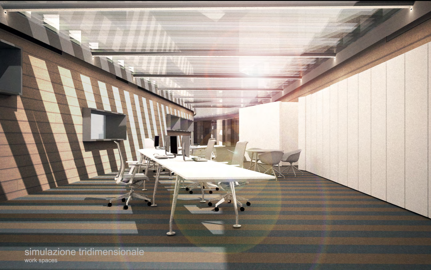
simulazione tridimensionale work spaces