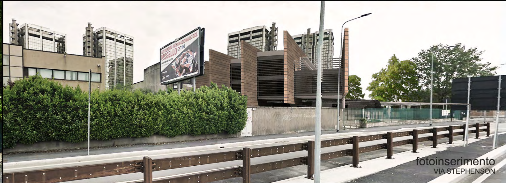
fotoinserimento VIA STEPHENSON