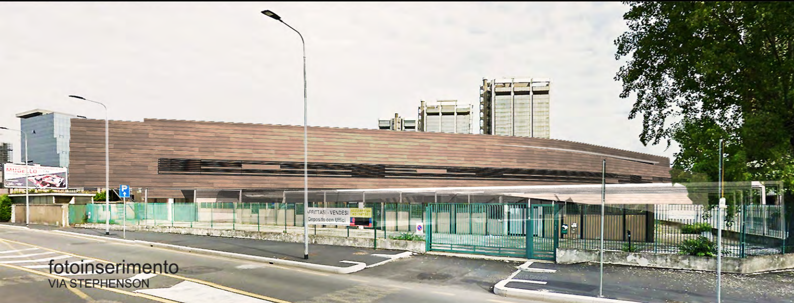
fotoinserimento VIA STEPHENSON