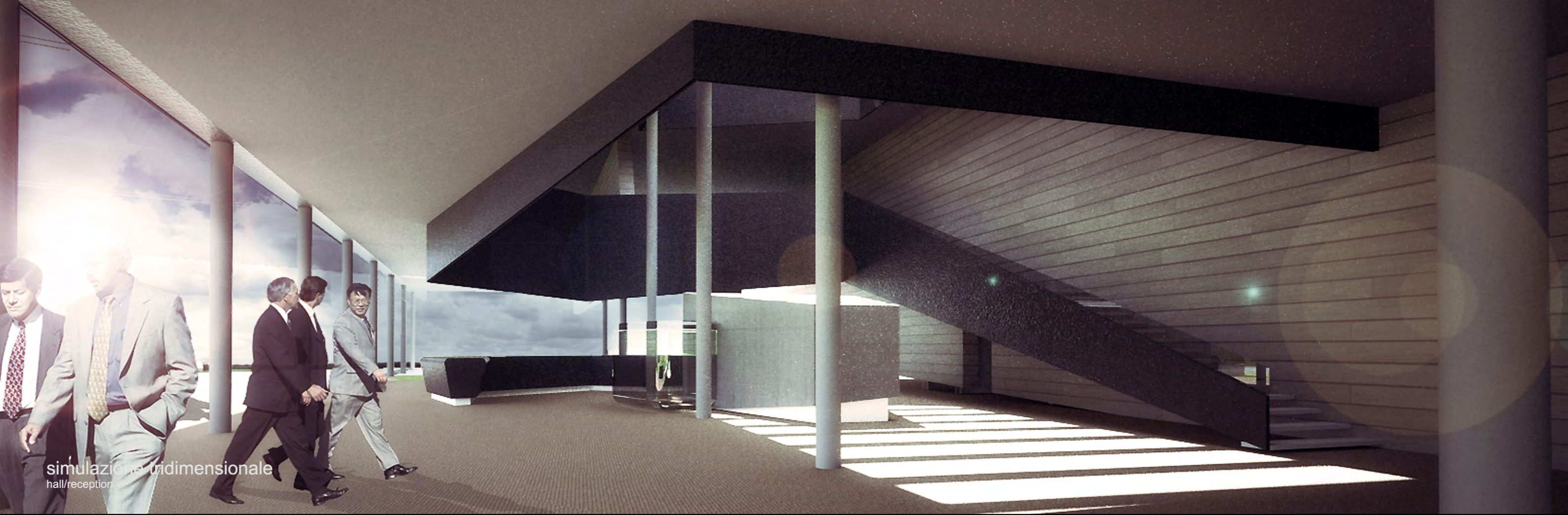
simulazione tridimensionale hall/reception