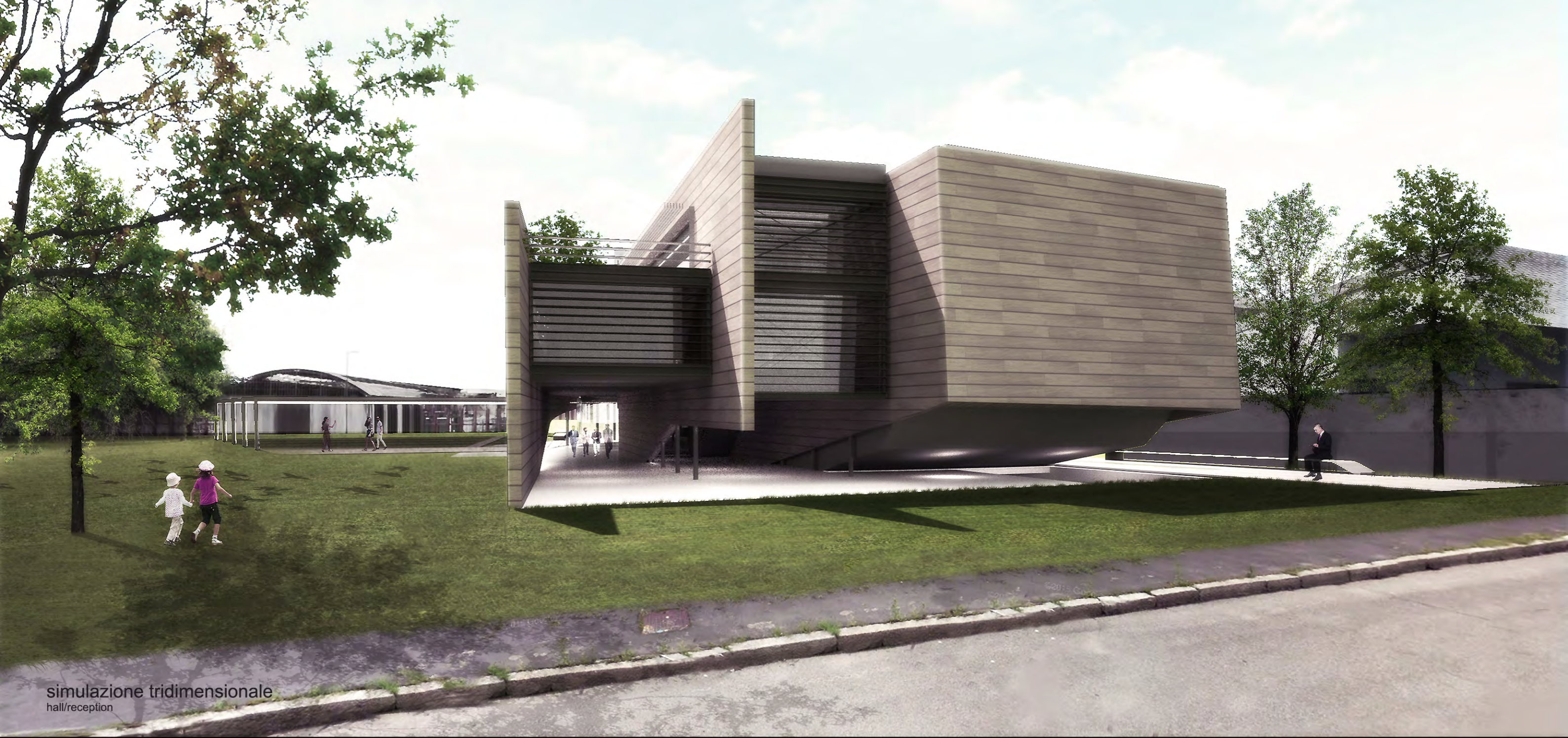
simulazione tridimensionale hall/reception