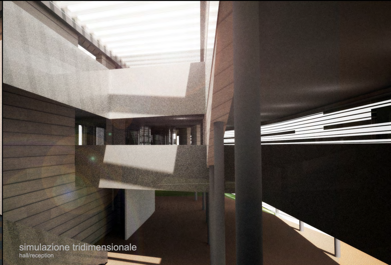
simulazione tridimensionale hall/reception